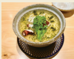
簡単和食(いすみ蒸し)