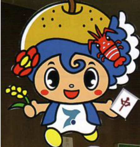
いすみ市マスコットキャラクター いすみん