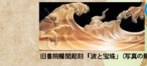
旧書院欄間彫刻「波と宝珠」(写真の彫刻)