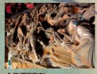
本堂欄間彫刻「牛若丸と大天狗の図」(写真の彫刻「波と飛龍」)