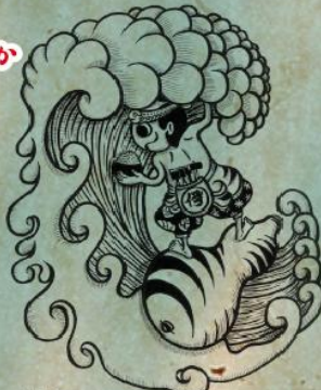
波の伊八マスコットキャラクター「波乗り伊八」